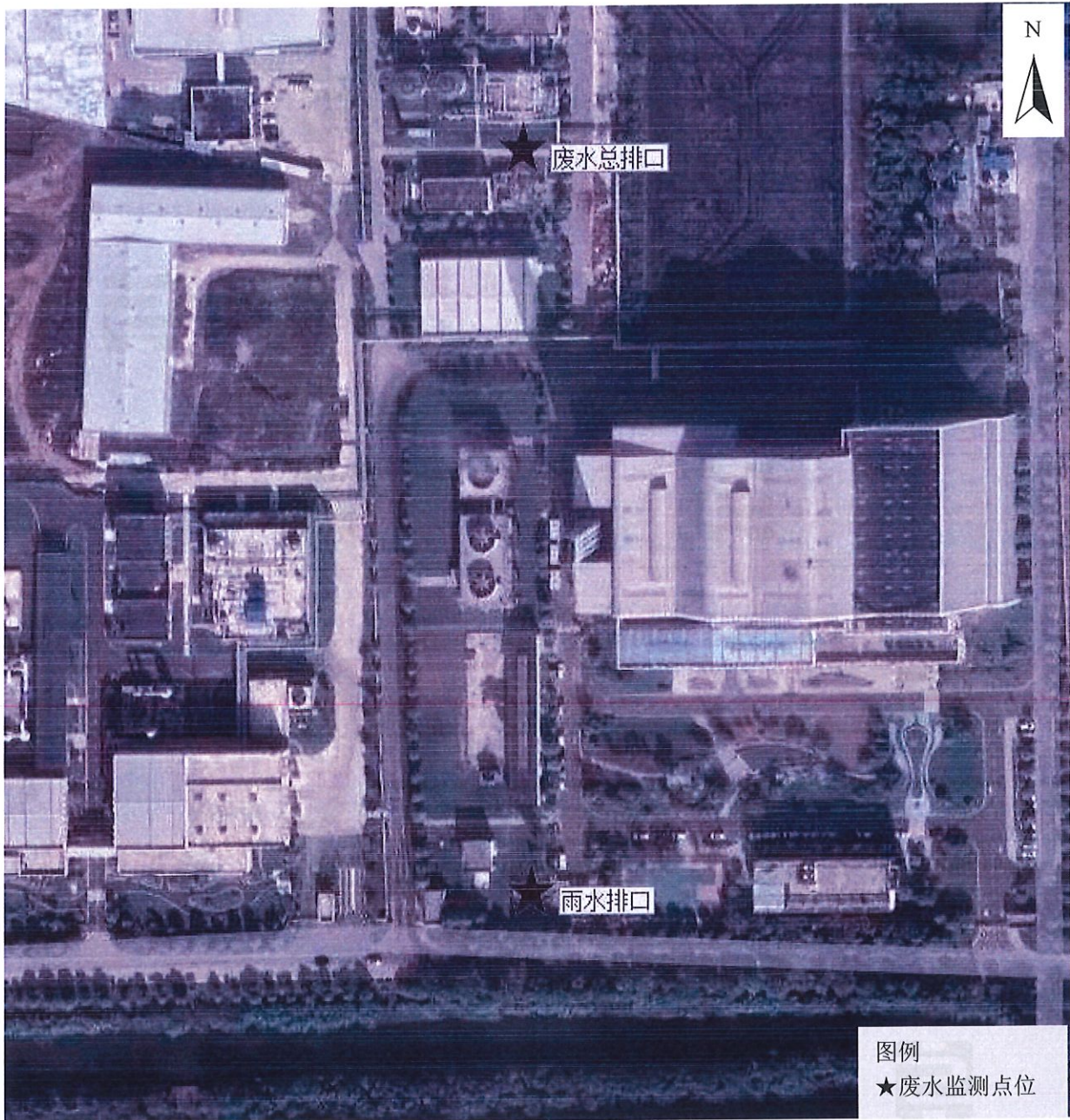
附图 1：监测点位示意图