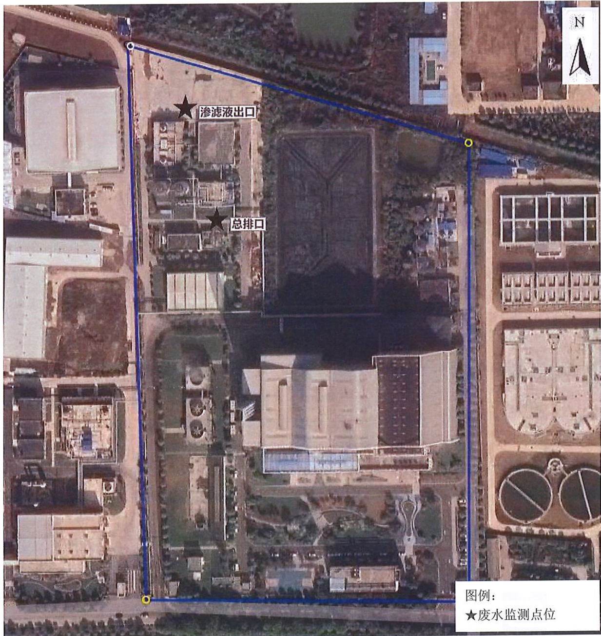
附图 1：监测点位示意图