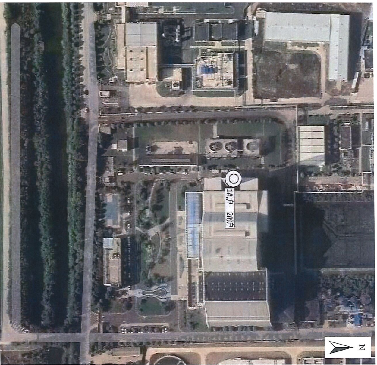
图例： ◎：有组织排放废气监测点位