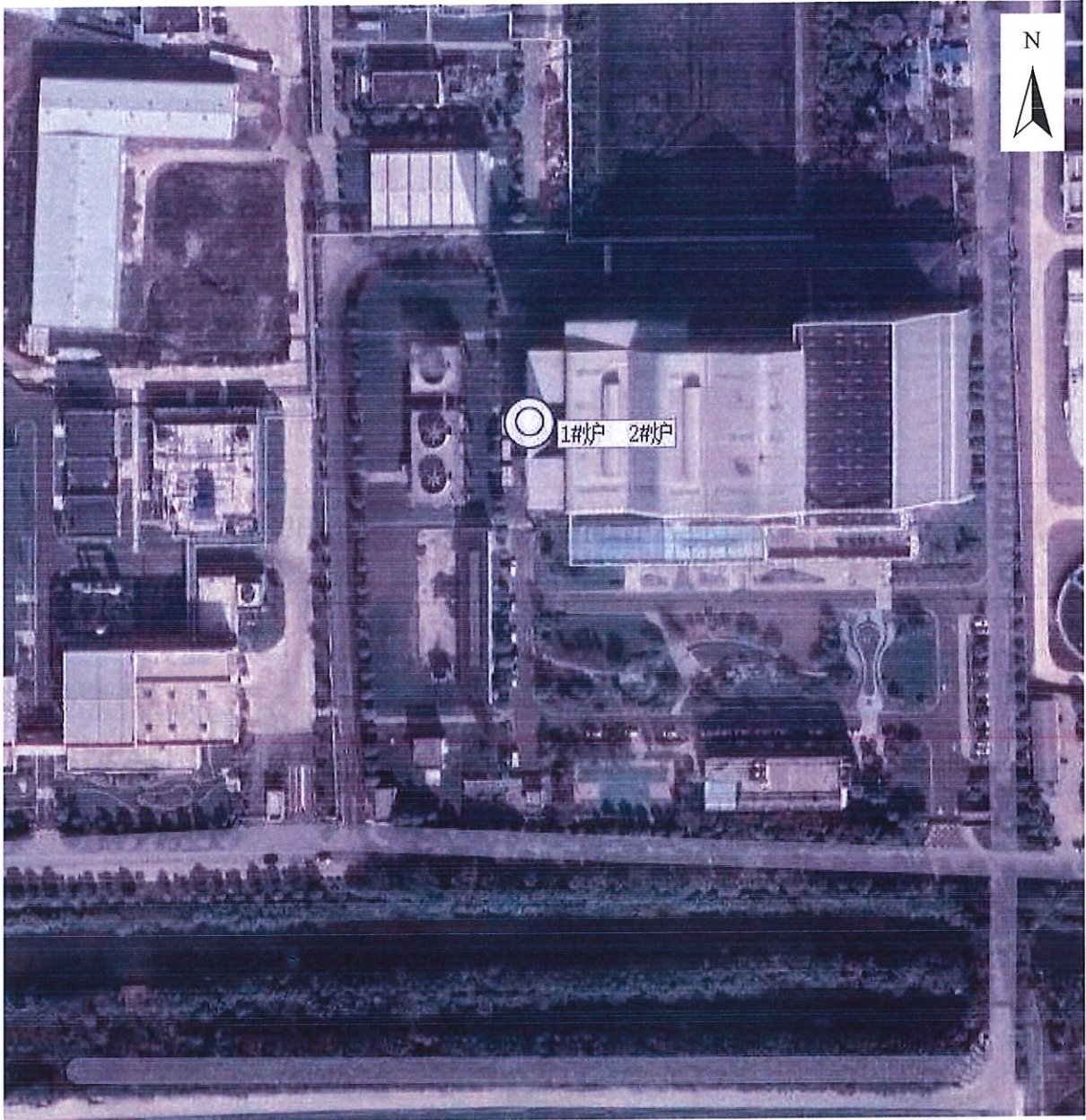
附图 1：监测点位示意图