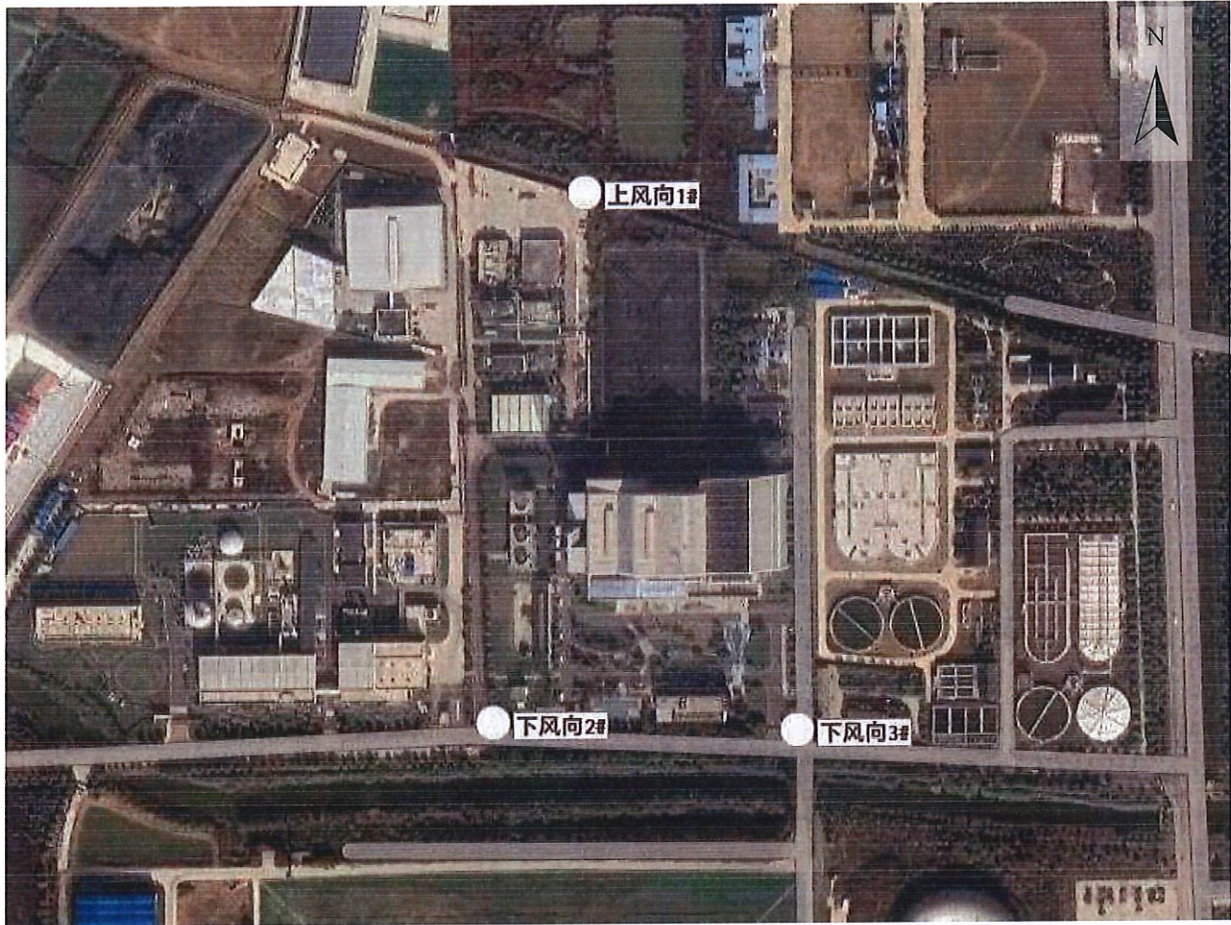
附图 1：监测点位示意图