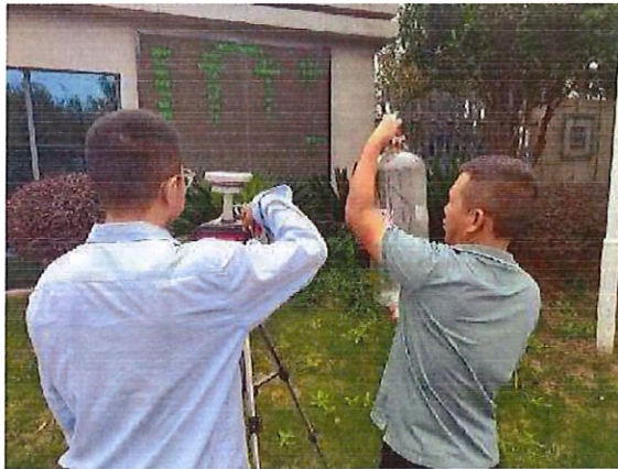
厂界下风向 3#（O3）无组织监测点位