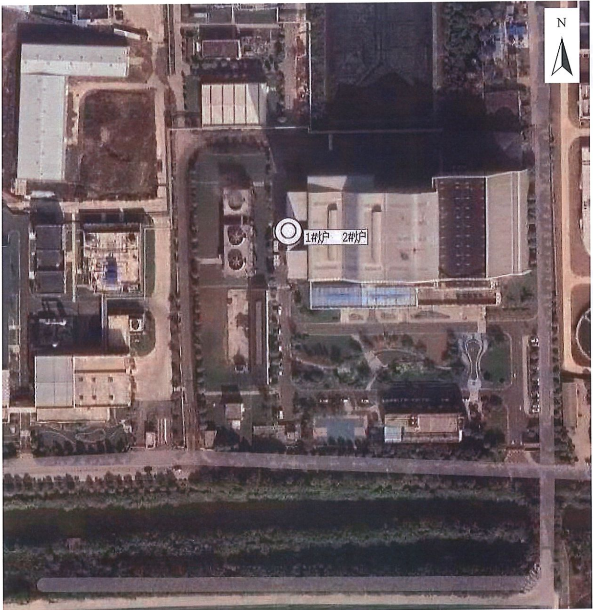
附图 1：监测点位示意图