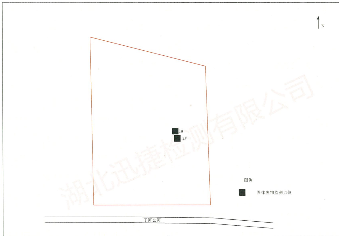
附图1 监测点位示意图