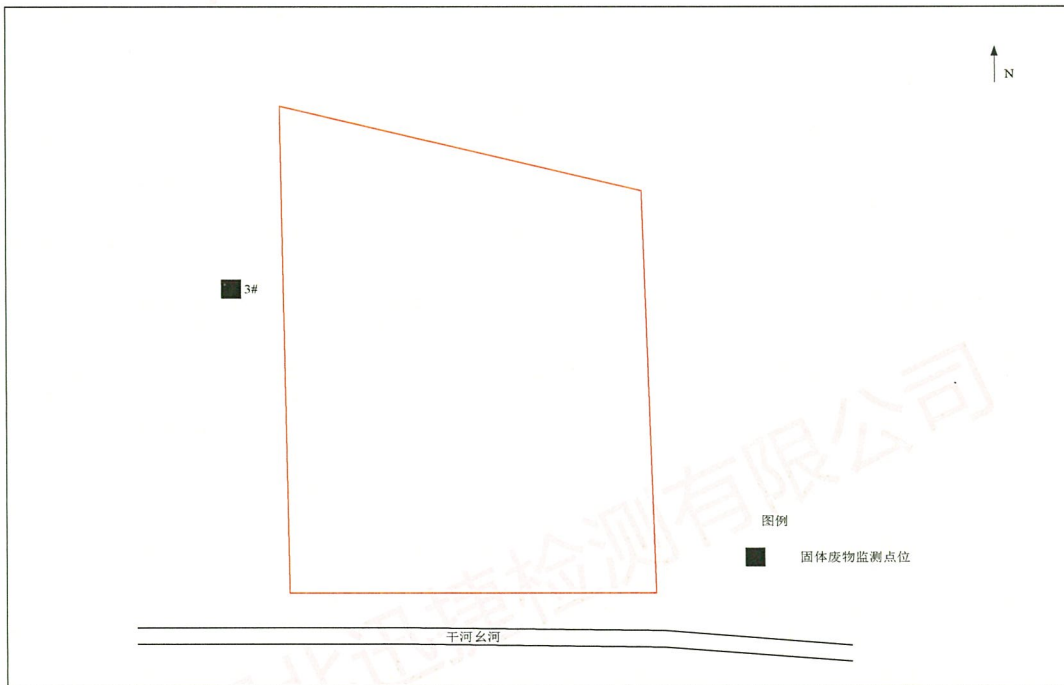
附图 1 监测点位示意图